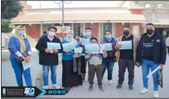
5- حملة توعية طلاب جامعة بدر بالقاهرة عن فيروس كورونا وطرق الوقاية من العدوي بمشاركة عدد 30 طالب من طلاب الكلية وذلك بتاريخ 2021/4/3.