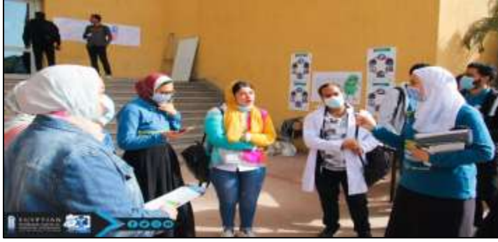
4- حملة توعية عن فيروس كورونا وطرق الوقاية من العدوي بمدينة أبو كبير محافظة الشرقية بمشاركة عدد 15 طالب من طلاب الكلية وذلك بتاريخ 2021/3/31.