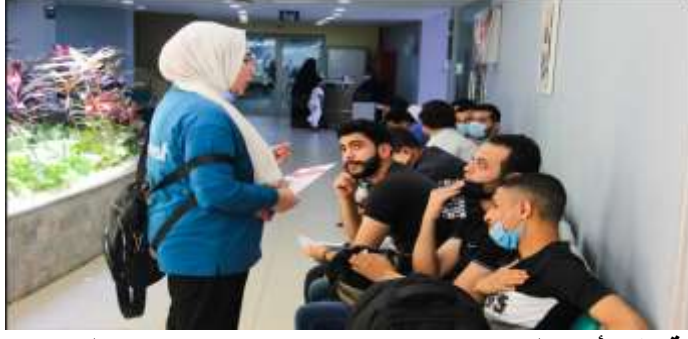
10- حملة توعية عن صحة المرأة والتي استهدفت سكان ضاحية مدينتي المجاورة للجامعة وذلك بتاريخ 2021/5/30 وتم توزيع مطبوعات تحوي مادة التوعية الصحية.