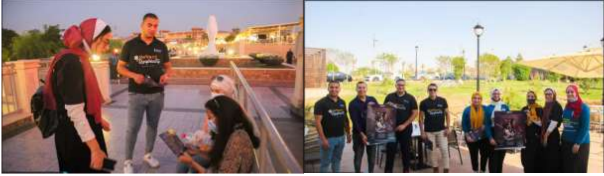
11- حملة توعية عن صحة المرأة والتي استهدفت سكان مدينة ابو كبير محافظة الشرقية وذلك بتاريخ 2021/6/12 وتم توزيع مطبوعات تحوي مادة التوعية الصحية.