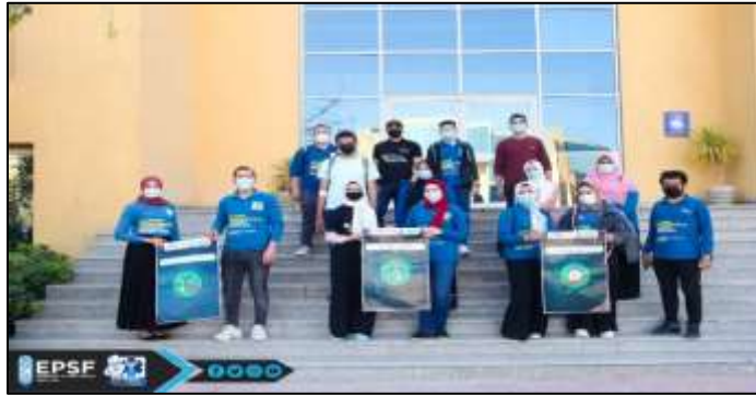
6- حملة التوعية المجتمع بأهمية دور الصيدلي المرحلة الاولى التي استهدفت طلاب كليات جامعة بدر بالقاهرة بمشاركة 35 طالب وقاموا بتوعية الطلاب عن امراض الجهاز الهضمي وامراض عدوي الجهاز التنفسي ودور الصيدلي في علاجها وذلك خلال يومي 26 و 27/4/2021.