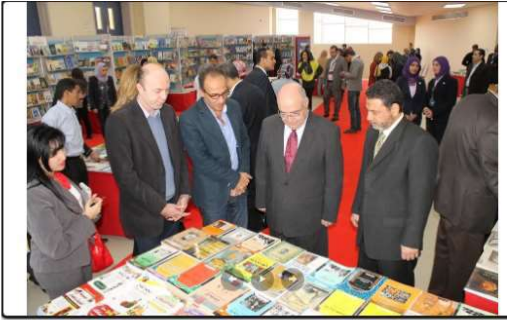
معرض الكتاب والفنون التطبيقية في المهرجان الدولي الثاني لجامعة بدر