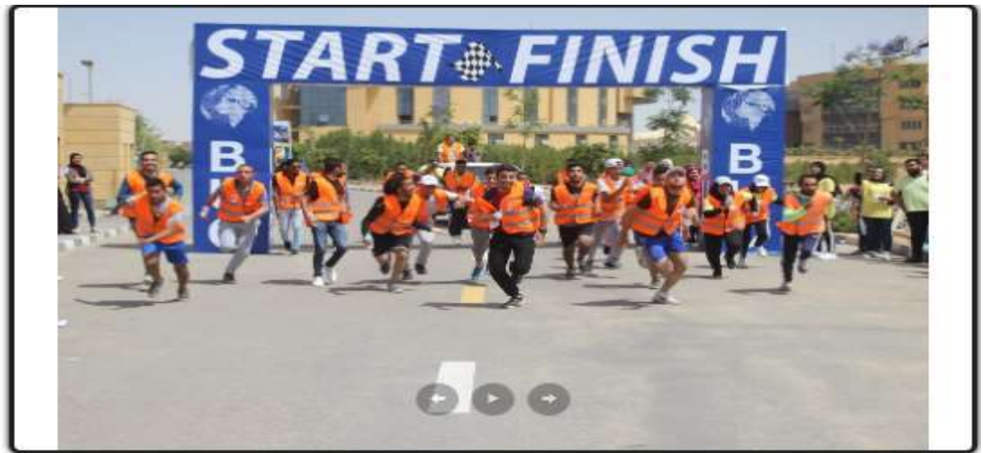
ماراثون الجري ضمن فعاليات اليوم الثالث للمهرجان الدولي الثالث لجامعة بدر